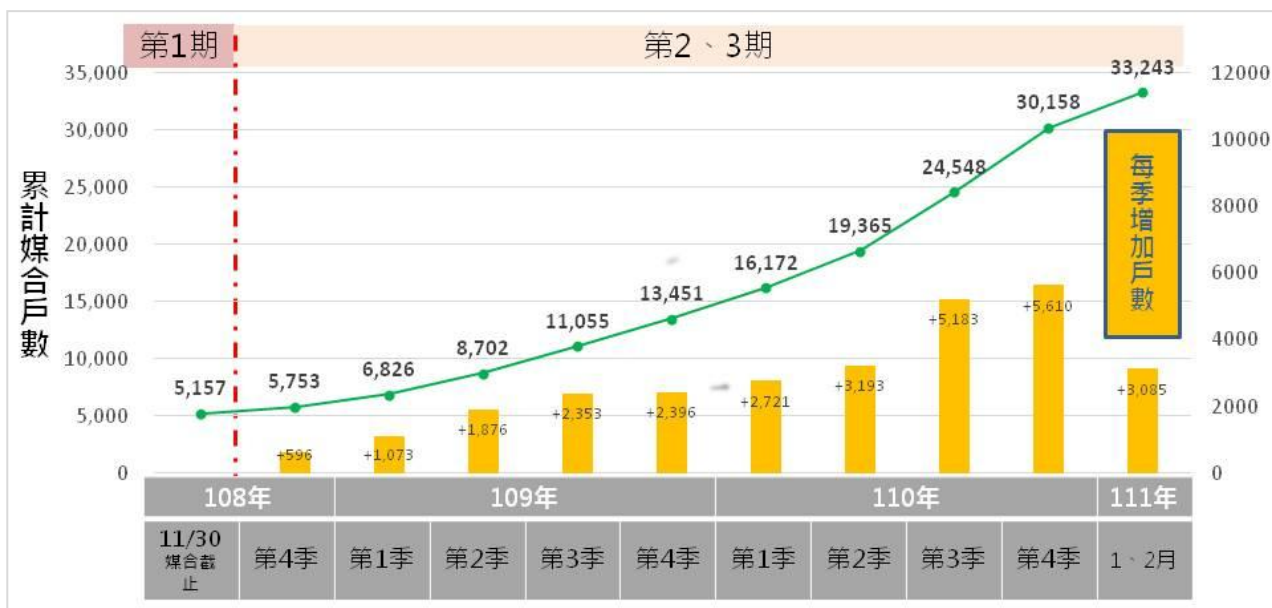
圖2、第1、2期計畫媒合戶數統計