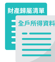
財稅機關所提供最近年度全戶所得資料及財產歸屬清單。